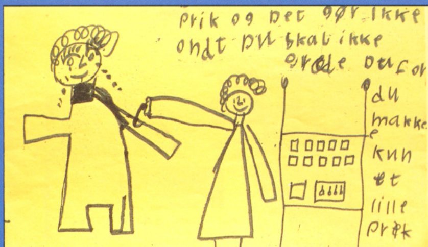
Børn er ofte meget præcise, når de udtrykker smerteoplevelsen i tegninger.

Når børn derimod føler sig trygge, har de lettere ved at give udtryk for deres følelser. Det er derfor vigtigt, at børn har en nærtstående person ved sin side, når de skal til undersøgelse eller behandling. Det understreger Helene: "Far og mor er de bedste i verden at klamre sig til, når man er bange!".