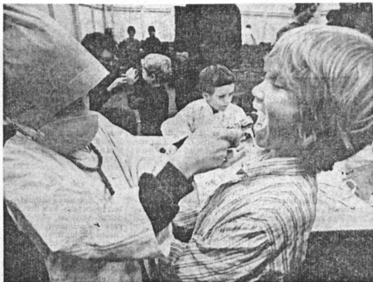
Orv, hvor kan man se langt med sådan en lille lygte, synes den lille doktor at tænke

I børnenes rollespil får »mor« lov til at være med ved